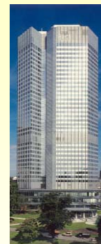
The European Central Bank